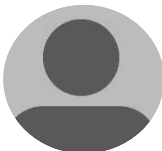
Assistante de service social En cours de recrutement